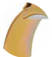
Fleje de alta resistencia con protección de zinc