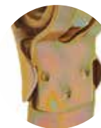
Soldadura anti desgarre